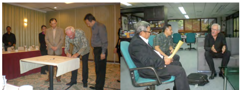
Ondertekening MOU te Bandung