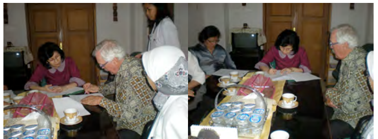
Ondertekening MOU te Jakarta

Reiskosten docenten: 12x module 1: €20 400,= 3x Jakarta, 2x Bandung 2x Denpasar, 1x Makassar 1x Solo, 1x Malang 1x New Delhi 1x Bangalore Studiebeurzen 4 fellows oncologie en 1 fellow urogyn: 4x module 2: 38 000,= Stage 1 urogyn. en 1 onc. Verpl. + fellow urogyn: 1x module 4: 7